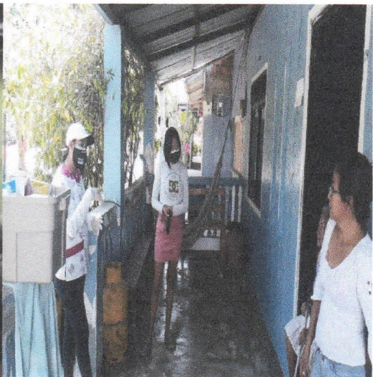
Proyecto de Desarrollo Infantil: En estimulación temprana, y entre otros.